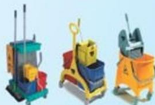
▲ Sistema de limpeza com balde duplo e espremedor