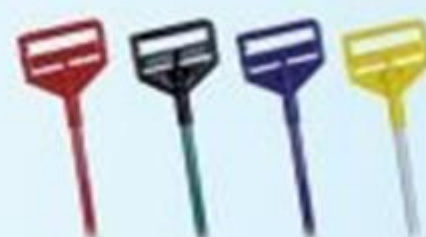
▲ Haste americana