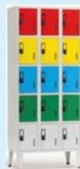
▲ Armário vestiário