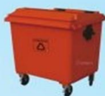
▲ Carrinho de plástico

QUÍMICOS: Detergentes, desinfetantes, sabonetes, odorizadores, desengraxantes, dentre outros da linha NEWDROP.