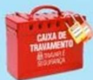
▲ Caixa de travamento