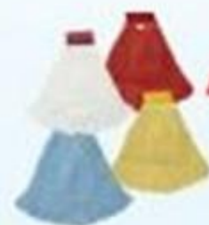
▲ Refil Mop úmido e seco