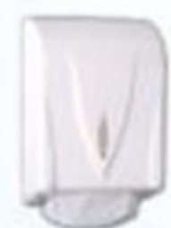
▲ Dispenser papel toalha