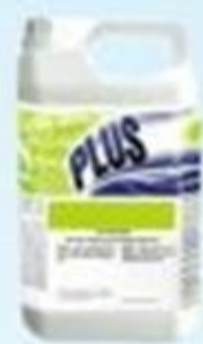
▲ Sabonete pitanga 5L