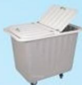
▲ Carrinho de fibra