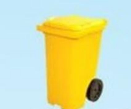
▲ Lixeira com rodas 120 e 240 litros