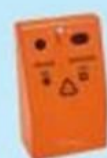
▲ Coletor de pilhas e baterias