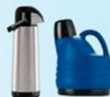
▲ Garrafa térmica