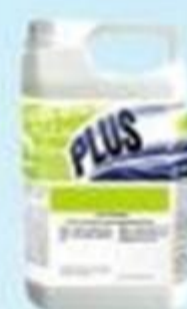
▲ Álcool em gel 5L