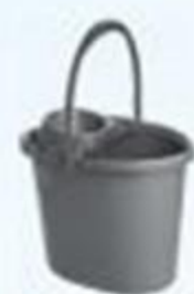
▲ Balde espremedor