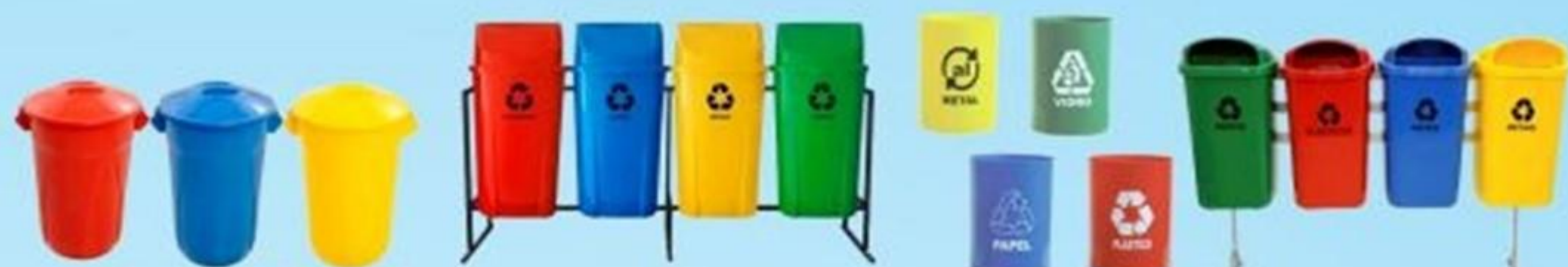
▲ Balde de 62 litros, com tampa

LIXEIRAS: Aço inox, plástica, fibra de vidro, aramados, entre outros.