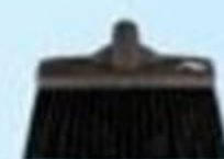
▲ Vassoura gari