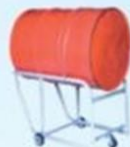
▲ Carrinhos de transportes de tonéis