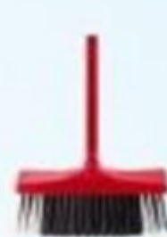
▲ Vassoura Panda