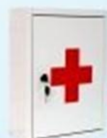
▲ Armário Primeiros Socorros