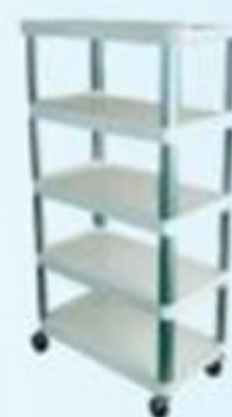
▲ Estante de aço 5 e 6 prateleiras