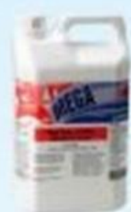
▲ Mega Sept floral desinfetante 5L

QUÍMICOS: Detergentes, desinfetantes, sabonetes, odorizadores, desengraxantes, dentre outros da linha NEWDROP.