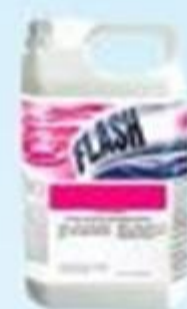
▲ Odorizante flash remove 5L