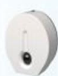
▲ Dispenser Papel higiênico