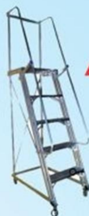
▲ Escada plataforma