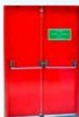
▲ Porta corta-fogo