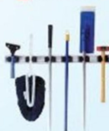
▲ Organizador de cabos