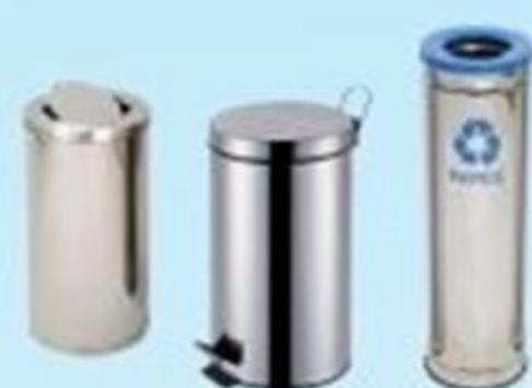
▲ Lixeira em inox