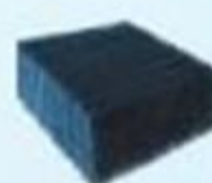
▲ Fibra de limpeza pesada