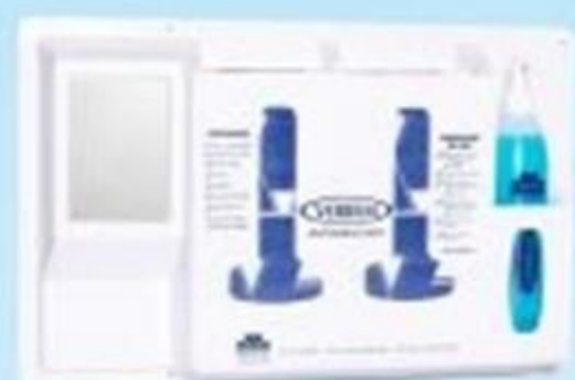
▲ Estação de limpeza