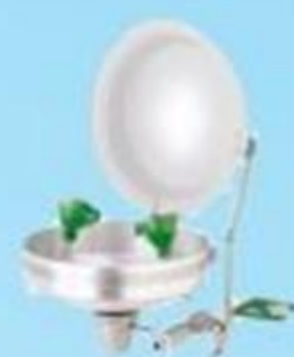
▲ Lava olhos