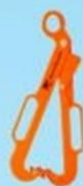
▲ Garra para tambor