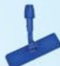
▲ Aplicador de cera