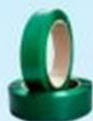
▲ Fita pet