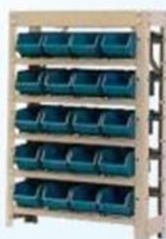
▲ Estantes organizadoras