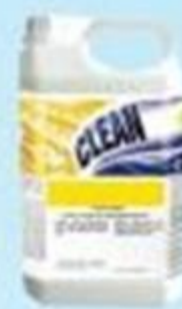
▲ Detergente Neutro 5L