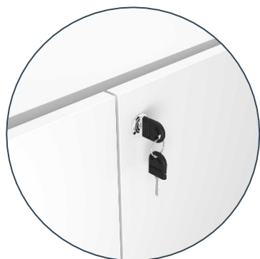
Chave dupla e dobrável