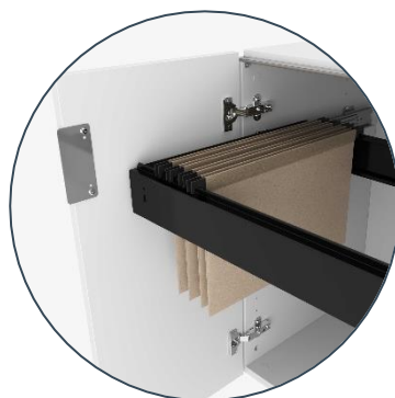
Opção de prateleira ou suporte para pasta suspensa