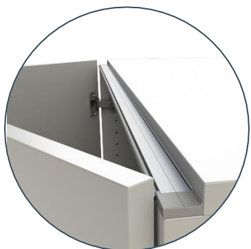
Perfil em alumínio